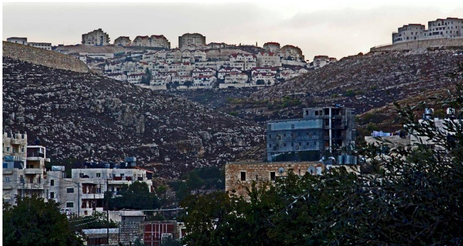
Bethlehem met op de achtergrond twee nederzettingen van Joodse kolonisten op Palestijnse grond, bij Salomons baden bij Bethlehem

In ‘Kom en zie’ is het ‘ik’ meer een ethisch project dat bewust wordt gericht op medemensen dan dat het een zoektocht naar het ‘ware zelf’ is. Om een adequaat verstaan te verkrijgen van de ‘Kom en zie’-pelgrimage bleek het noodzakelijk om de theologische en historische factoren te onderzoeken die het verschijnsel pelgrimage vanaf het begin van het christendom deden ontstaan.