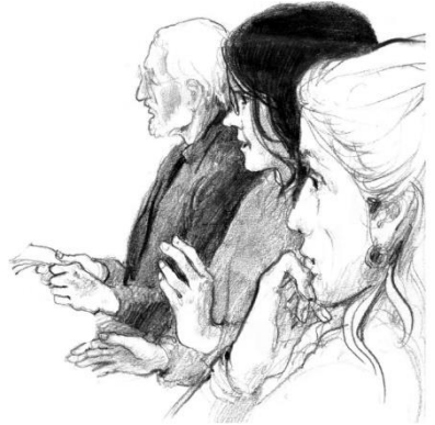
stille samenkomst van Quakers

Daarom wees stil en laat varen je eigen gedachten, je eigen streven, je eigen zoeken, je eigen verlangens je eigen hersenspinsels.