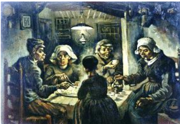
De aardappel-eters van Vincent van Gogh De minder geprivilegieerde familie

Hoe heb je gescoord? Als je veel Ja hebt gescoord, profiteer je waarschijnlijk van privileges op basis van je sociale klasse. Lees dan verder!