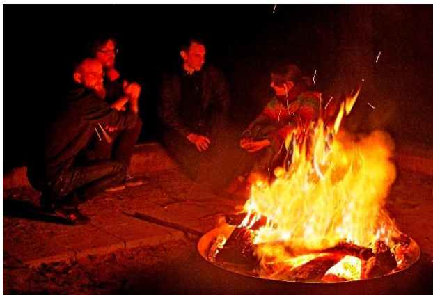
een diep gesprek bij het kampvuur op de AV 2019

De stilte helpt verder om vooropgezette meningen los te laten. Uiteraard is een goede voorbereiding van belang, maar die moet niet tot gevolg hebben dat standpunten tijdens de vergadering niet meer losgelaten kunnen worden. Anders kunnen er nooit nieuwe oplossingen gevonden worden. Tenslotte is het vragen om stilte ook een middel om, zo nodig, de orde te herstellen.