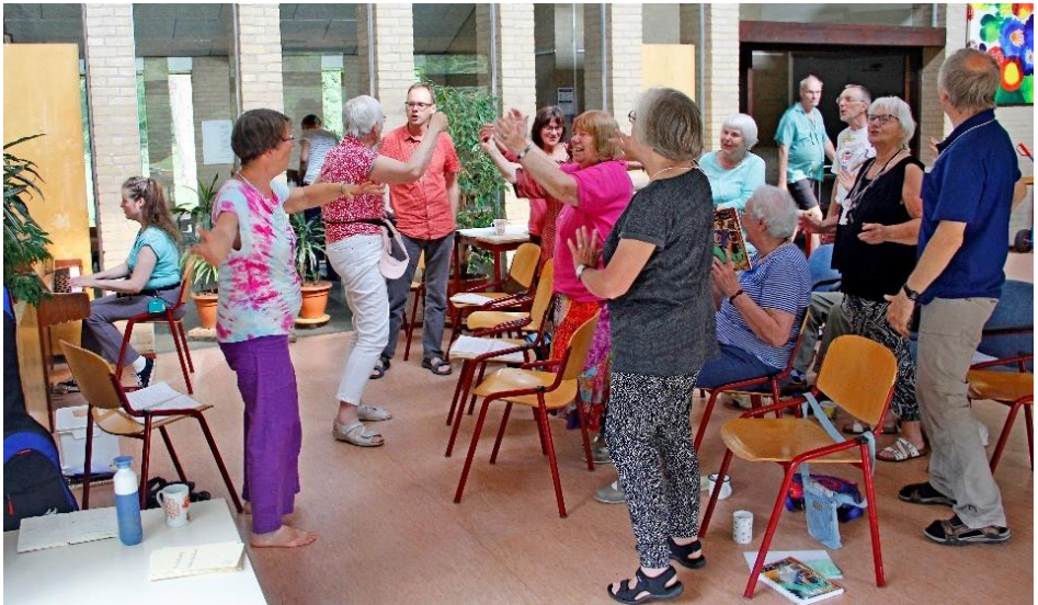
zingen en bewegen op de AV in 2018

De zakenvergadering van de AV is net als de wijdingssamenkomst gebaseerd op de stilte. In de richtlijnen staat: 'Stille inkeer aan het begin en eind