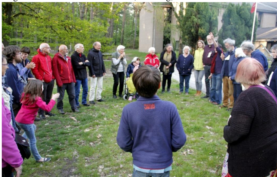
buitenactiviteit voor jong en oud op de AV in 2019