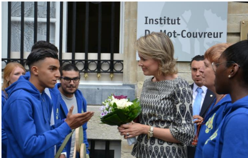
De Belgische 'Ambassadeurs van de dialoog' ontmoeten Koningin Mathilde van België. Zij zijn eerder op een dialoog reis naar Israël en Palestina geweest.

Als Yalla! betreuren wij ieder onschuldig burgerslachtoffer aan zowel de Palestijnse als Israëliëse zijde. Het liefst zouden we een rechtvaardige, duurzame oplossing zien daar waarbij compassie, gelijkwaardigheid en echt luisteren naar elkaars perspectief, centraal staan. Daarvoor is de totstandkoming van een andere politieke realiteit nodig, dan diegene die we nu al geruime tijd zien. Alleen gaan wij daar niet over.