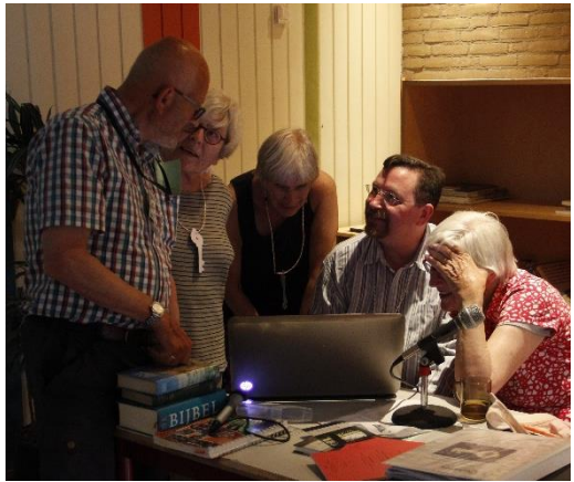
Ontmoeting en uitwisseling