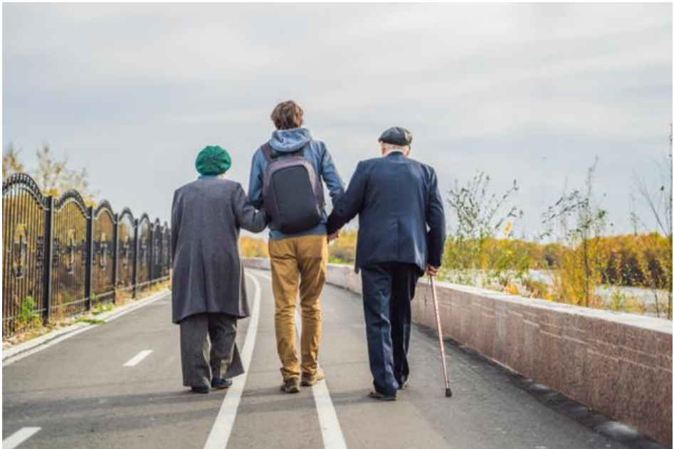
De Gulden Regeltoepassen (Mt 7:12 )

Ik denk bij de liefde voor de vijand aan: de ander recht doen en de Gulden Regel volgen en behandel de ander zoals je zelf behandeld zou willen worden (Mt. 7:12 / Luc. 6:31). Jezus noemt die regel in Mattheüs het hart van de Wet en de Profeten.