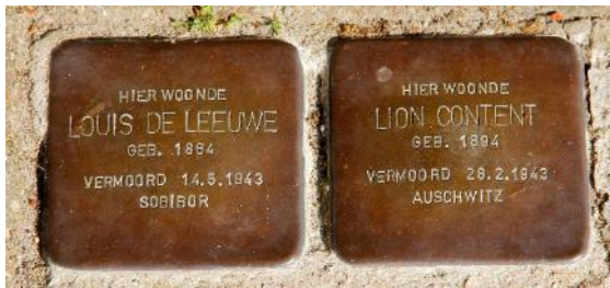
Stolpersteine gedenken de vermoorde joodse wijkbewoners