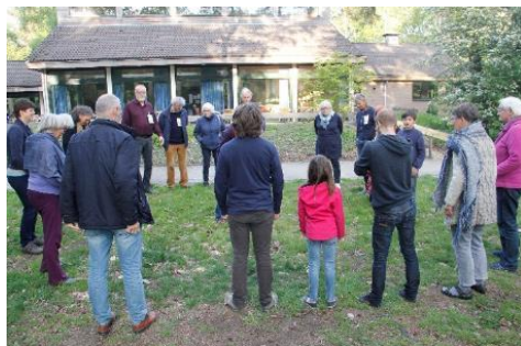
Algemene Vergadering 2019 in de Bosbeek

We kunnen tot onze verrassing nog op dit late tijdstip van het jaar terecht in de Bosbeek, dat prachtige huis in de bossen van Bennekom. In dat huis waar we