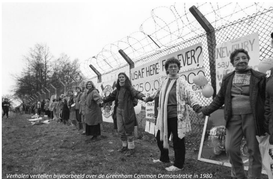
Verhalen vertellen bijvoorbeeld over de Greenham Common Demonstratie in 1980