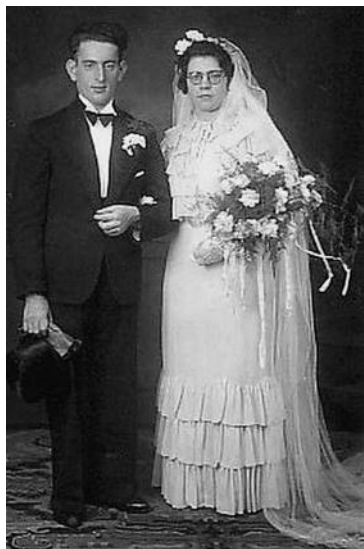
vermoord in Auschwitz