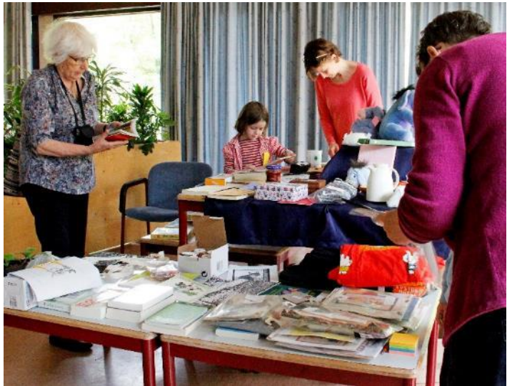
De verkooptafel in 2017