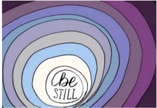
Thema van de Gorman lezing

Het is tien jaar geleden dat de Britse jaarvergadering zich inzette om een CO2-arme, duurzame geloofsgemeenschap te worden. Vrienden over de hele wereld hebben al lang vóór ons een concern gehad om in de juiste relatie met de schepping te leven. We rouwen om de planeet waar we van houden - ons huis - maar we hebben geen tijd om