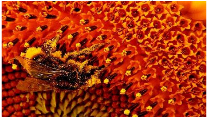
De hommel van de bovenstaande foto voedt zich uitbundig met het gele stuifmeel van de buisbloemen, dit is het eerste stadium, in het tweede stadium ontwikkelen de buisbloemen ook stampers en kan de hommel bestuiven. Dan kunnen er zaden gaan groeien