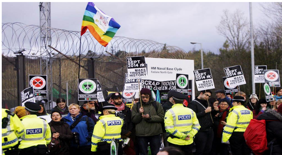
Protest tegen nucleaire onderzeeërs

Als Vrienden zijn we er nooit van overtuigd geweest dat gezamenlijke verklaringen en persoonlijke getuigenissen voldoende zijn. We hebben altijd geprobeerd om een praktische uitdrukking te geven aan ons geloof. Actie heeft verschillende vormen aangenomen en omvatte publiek protest, het verlichten van lijden, wederopbouw en het wegnemen van de oorzaken van oorlog door middel van bemiddeling, verzoening, ontwapening, het opbouwen van vredesinstellingen, het bevorderen van sociale rechtvaardigheid en het werken aan de basis van conflicten en geweld in ons persoonlijk gedrag