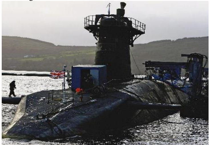
Faslane Nucleaire Onderzeeërs Basis

Op 4 april heb ik een keuze gemaakt. Ik koos ervoor om de droom van een andere weg te creëren. Mijn enige misdaad is dat ik niet hard genoeg, of lang genoeg, of snel genoeg werk aan de vervulling van die droom. Als mijn acties een misdaad waren, dan ben ik schuldig.