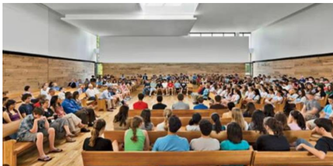
Ook in grote groepen kan Quaker besluitvorming plaats vinden

In dit proces zijn de deelnemers niet elkaars rivalen maar Vrienden die gezamenlijk proberen de stem van de Liefde te verstaan en te vertalen naar actie. Deze vorm van besluitvorming kent geen winnaar. De groep als geheel voelt zich winnaar en dit versterkt de onderlinge band.