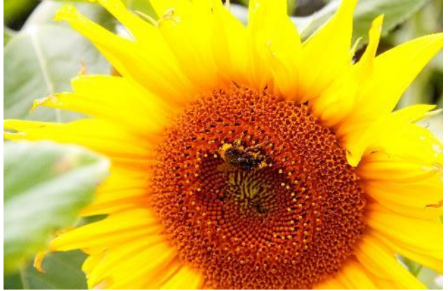
De zonnebloem bestaat uit straalbloemen aan de rand fel geel, en de buisbloemen die met stuifmeel dat lekker is voor bijen en hommels en die ook zaden voort brengen

moslim. De 'Ka'aba' is het hart van de islam: "vijf keer per dag richten wij moslims ons naar de 'Ka'aba' – het huis van God – om onze 'salaat' te bidden". De bloem draait en danst driftig mee met de opwaartse en neergaande beweging van de zon: rechtop, trots en uitdagend. Deze meebewegende periode hebben wij ook in ons leven en komt langzamerhand tot een einde. We komen tot het inzicht dat er meer onder de zon is dan dit, op het aardse gerichte, leven. De 'roekoe' houding in ons gebed komt absoluut overeen met de voorovergebogen rijpe zonnebloem.