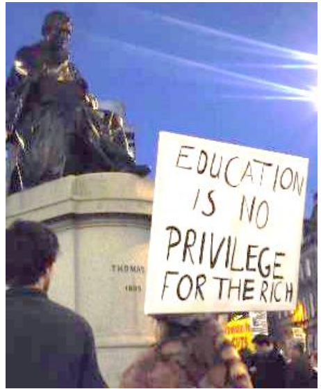
Protest bij het monument van Thomas Jefferson

Gedurende een groot deel van de 20e eeuw werd gedacht dat er grofweg drie klassen waren: hoger, midden en lager. Maar de afgelopen jaren is in sommige landen de polarisatie tussen de bovenste 10% en de onderste 10% toegenomen: de zeer rijken zijn rijker geworden, de zeer armen zijn armer geworden en de ongelijkheid is aanzienlijk toegenomen. Nu is er een kleine rijke stedelijke elite die heeft geprofiteerd van de recente economische transformatie. Zij heeft aanzienlijk meer rijkdom, macht en privileges