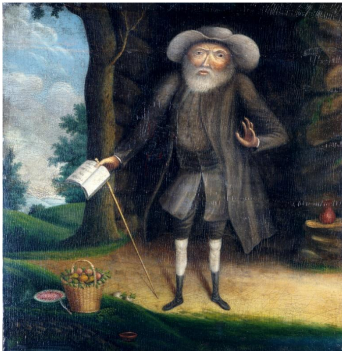
Benjamin Lay geschilderd door William Williams in 1750

Als jongen in Engeland werkte Lay op de schapenboerderij van zijn broer en daarna als leerling bij een handschoenenmaker. Op zijn eenentwintigste liep hij weg naar zee, waar hij na het harde werk veel boeken las. Hij noemde zichzelf een simpele, ongeschoolde matroos, maar in feite was hij heel belezen. Als zeeman zag hij heel wat van de wereld, ook Syrië en Turkije, waar hij vier Engelsen ontmoette die al zeventien jaar slaaf gemaakt waren door moslims. Hij zwabberde het scheepsdek met mensen die op Engelse slavenscheepen hadden gevaren en hoorde hun verhalen over verschrikkelijke wreedheden. Terug in Engeland trouwde hij in 1718 met