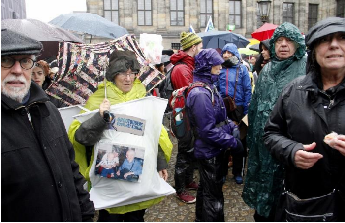
Enkele Quakers bij de klimaatmars in Amsterdam 10 maart in de stromende regen