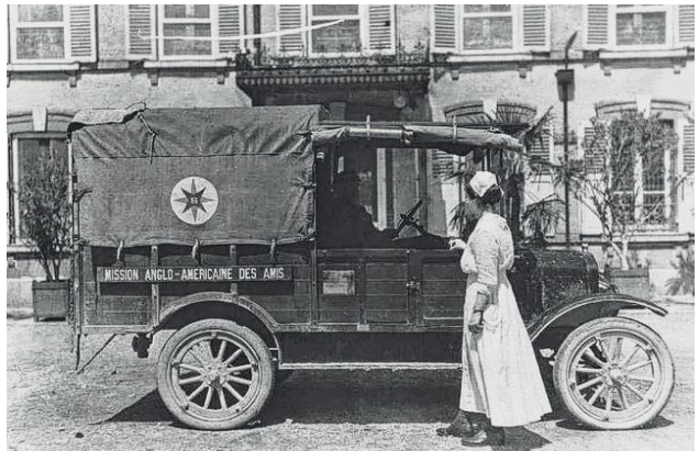
hulp door Quakers in Wereld Oorlog 1

‘Vrienden’ nog wel van deze tijd was, want er waren ook ‘Vriendinnen’. De Remonstranten hebben ook het ‘Broederschap’ uit hun naam weggelaten; Vandaar dat ik hem met een knipoog mijn geslachten gender neutrale oplossing voorstelde: ‘Orde de Quakers’ Of - nu ik toch fantasieer- gebaseerd op de voorloper: