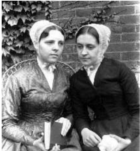
Denken jullie nu echt dat het voor Jezus uitmaakt hoe je je kleedt?