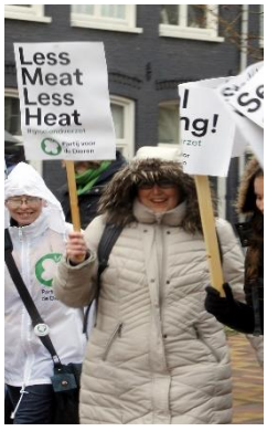
Jongere Quakers uit Europa lopen ook mee met de klimaatmars