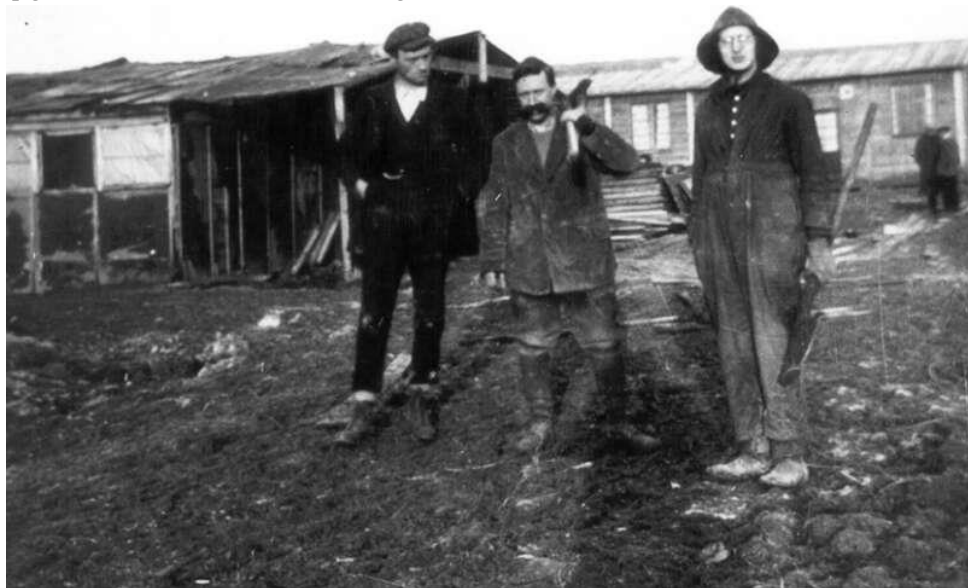
1 ste Werkkamp van SCI bij Verdun in 1920 te Esnes-en-Argonne

* (SCI = Service Civil International, een vredes en humanitaire organisatie opgericht na de 1 ste wereldoorlog door Pierre Ceresol, een Quaker)