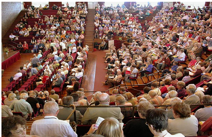
Organisatievorm: Quaker zakenvergadering in York

Deze organisatievorm is gebaseerd op wat door George Fox "Gospel Order" werd genoemd; Een ordening die principieel op het evangelie is gebaseerd. De betekenis en concrete uitwerking