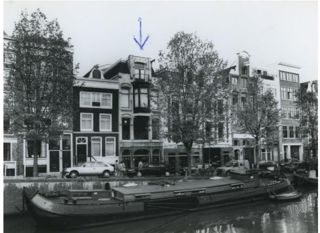
Schuilplaats waar de Joodse kinderen verborgen werden gehouden in WO II