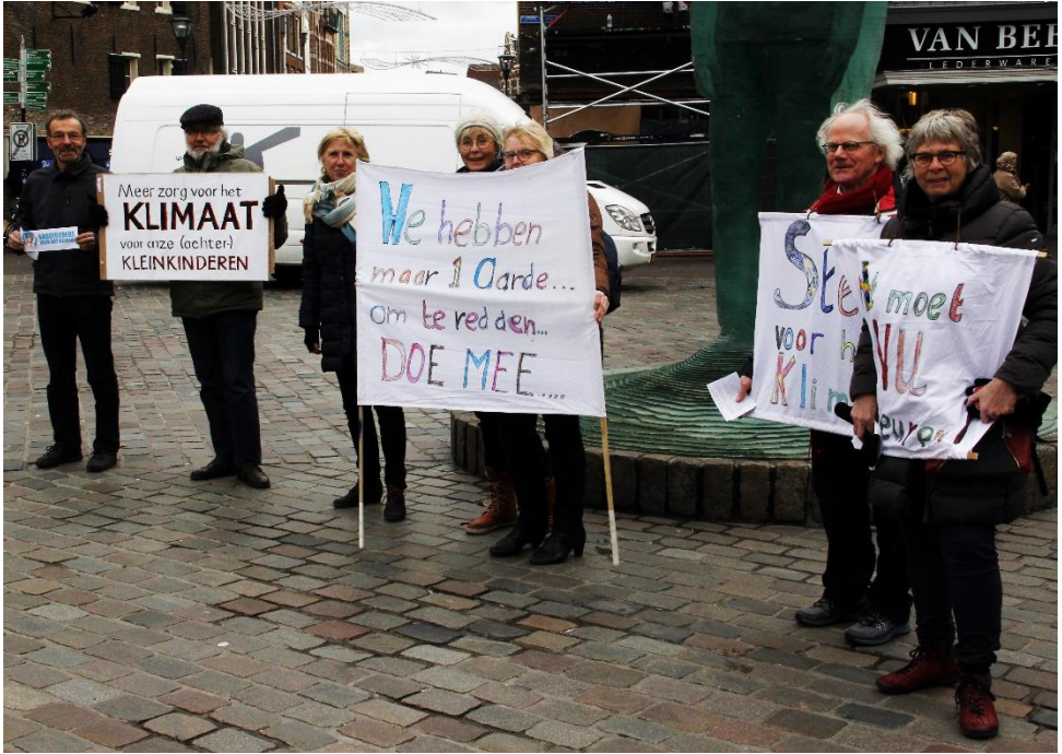
'Alle' Quakers in Zwolle deden mee.