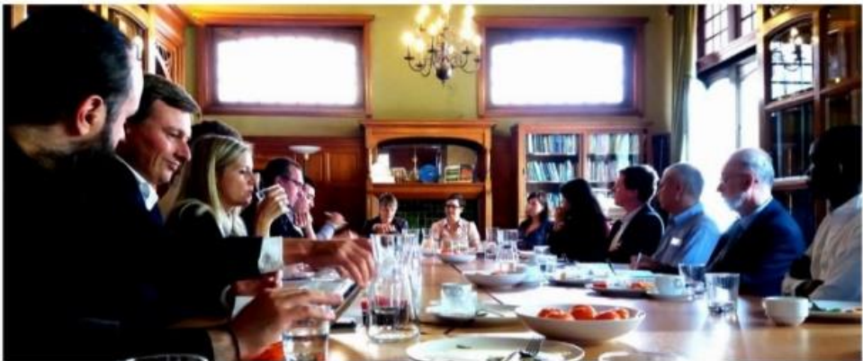
Een foto van onze uitdagende-discussie over het onderwerp waarheid, die we in het Quakerhuis in Brussel op 4 september hielden