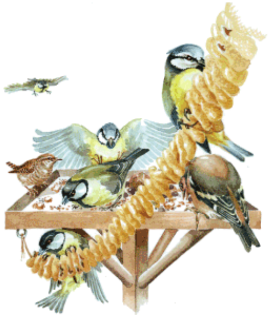
de tuin is 'woest en ledig', met veel vogels