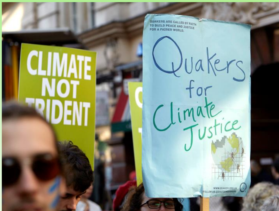
Opkomen voor klimaat-rechtvaardigheid.

Maandblad van het Religieus Genootschap der Vrienden (Quakers) website: www.Quakers.nu ; 89e jaargang nr 10, november 2018.