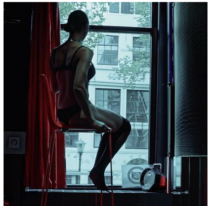
Laura is slaaf in de prostitutie