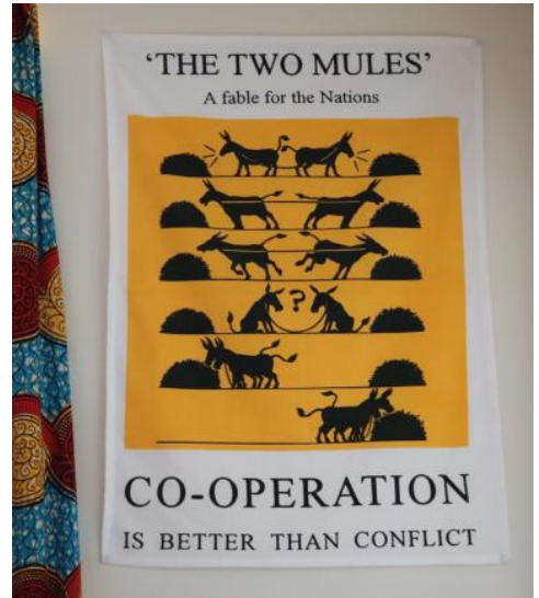
de twee muilezels: samenwerken is beter dan conflict

spiegelt. Wij zetten ons geloof om in actie op heel wat kleine punten. Ik begin mij af te vragen: zijn deze specifiek voor ons of zijn ze universeel voor alle Quakers? Om te beginnen de prent van de twee muilezels, want kom op, wie heeft nog nooit een bezoek gebracht aan de Friends House ca- deaushop? De onze hangt in onze slaapkamer, dus we worden na het wakker worden als eerste herinnerd aan de voordelen van samenwerking. We hebben een uitgebreid afval-sorteerstation. Naar aanleiding van de op- ties die onze stad biedt, sorteren we ons afval in gft, kunststoffen, papier en restafval. En niet alleen dat. We hebben ook graag contact met onze vrienden in andere steden over hun sorteer-mogelijkheden. “Wist je dat Leuven nu een roze container voor zacht plastic heeft?” “Waar denk je dat padden- stoelen- kartons in moeten?” En dan onze Quaker lectuur: Literatuur over andere godsdiensten en verder de aan duurzaamheid, vrede of eenvoud ge- relateerde boeken. Wij kennen de Quaker voorliefde om onszelf te onder- wijzen, hetzij door de kleine rode publicaties van de Cary-lezing, hetzij door de Jonge Quakers-podcast. En dan ons fietsen! Om heel eerlijk te zijn: we leven in een grote stad, zodat we waarschijnlijk een auto toch niet missen. We fietsen en gebruiken het openbaar vervoer zo gewetensvol dat mensen ons voor gek verslijten, vooral als we drijfnaat op het werk aankom- men. We hebben bordjes "Een auto minder", we hebben naaidozen,