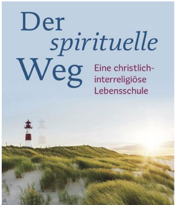
Het boek van Bertram Dickerhof

Uit dit schouwende, horende zijn vloeien stappen voort op de weg naar het ware Zelf. Ten diepste is dit een geschenk, dat wij niet kunnen maken. Maar wij kunnen en mogen ruimte scheppen voor het verlangen ernaar. De cursussen, bijeenkomsten en de regionale groepen van de Ashram Jesu bieden hierbij ondersteuning.