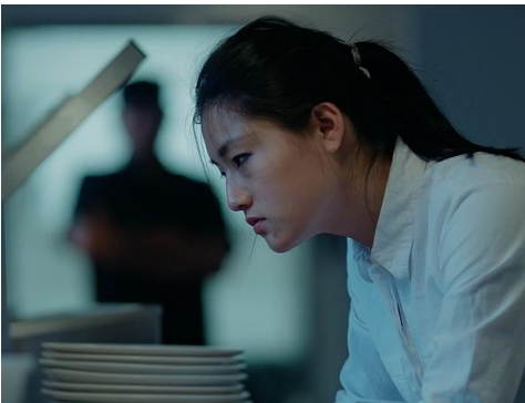
Ling is slaaf in een restaurant

Bij QCEA wordt gewerkt aan een idee om ons in te schakelen bij meer onderzoek naar moderne slavernij in Nederland. Misschien is hierover in een volgende Vriendenkring meer te melden, al zullen activiteiten daarvoor pas volgend jaar vorm krijgen.