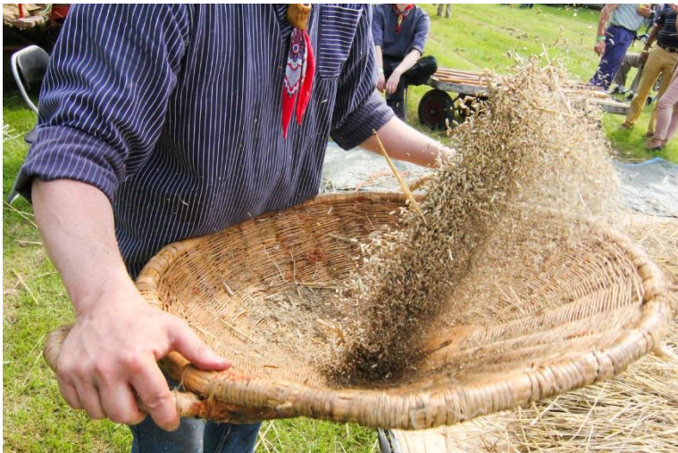
het kaf van het koren scheiden

Ook over "vlegel" zou ik me verblijden: Want wie zou nou niet het kaf van het koren willen kunnen scheiden?