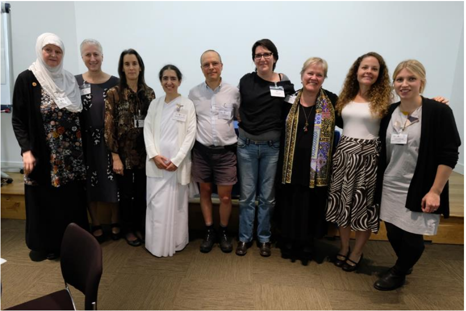
Vertegenwoordigers van verschillende geloofsgemeenschappen bijeen in Friends House London om de 'Living the Change' Interfaith Sustainable Living Celebration te vieren