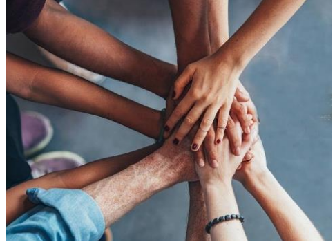
de kerk als gemeenschap

Tegelijkertijd ben ik mij als Quaker bewust van mijn behoefte aan een eigen plaats en gemeenschap, een zichtbaar thuis, om mijn eigen weg te kunnen blijven volgen. Ik heb een familie nodig, maar ook een kring van vrienden. Families zijn echter niet altijd gemakkelijk om mee te leven. Niet alle families zijn erg vriendelijk. Sommigen houden zich meer bezig met ge-