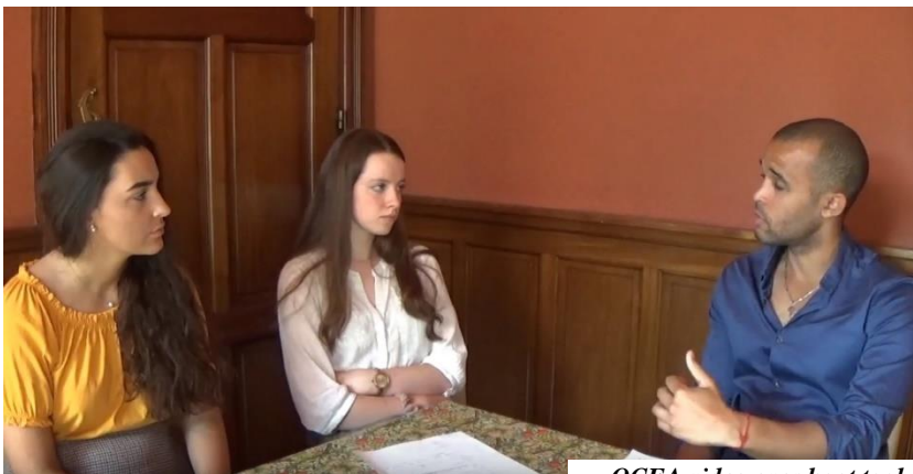
QCEA video over haat taal

De QCEA interventie is te zien op ons YouTube kanaal door op YouTube te zoeken met de tekst “Quaker Council for European Affairs”. Door je daar (gratis) te abonneren krijg je een melding bij toekomstige QCEA vi- deo clips. Zie bijvoorbeeld: https://www.youtube.com/watch?v=11JYU4cmnav Voor een video over haat taal in Europa.