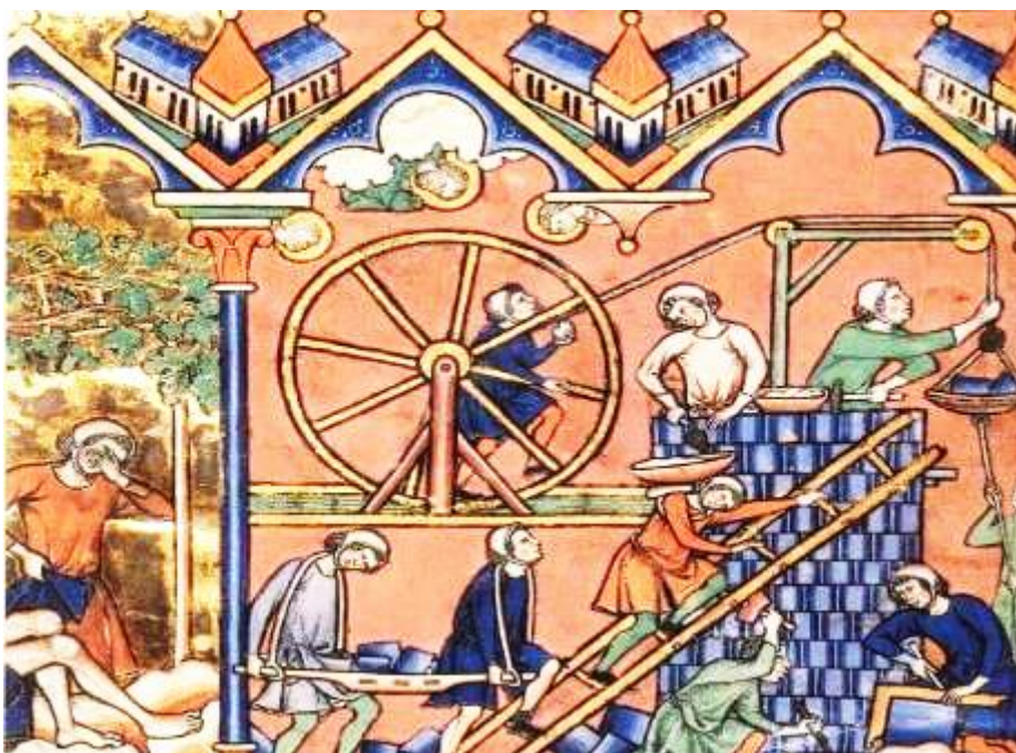
Euwen bouwen aan een kathedraal, het proces is belangrijker dan het resultaat

Het was een fijn en inspirerend samenzijn.