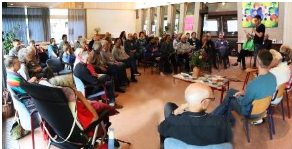
rapportages vanuit de basisgroepen