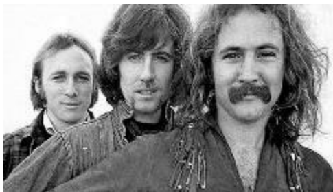
'Wooden Ships' van Crosby, Stills and Nash

'If you smile at me, I will understand. Because that's what everybody everywhere does in the same language' (uit het lied 'Wooden Ships' van Crosby, Stills and Nash)